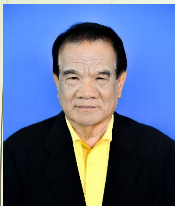
พลตำรวจโท ยุทธนา ไทยภักดิ์ สมาชิกวุฒิสภา กรรมการกองทุนเพื่อผู้เคยเป็นสมาชิกรัฐสภา